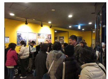
受付にてFMラジオを貸し出し。操作方法を説明(健常者も体験可)

今年も2020年12月下旬に開催する予定です。詳細についてはKBCラジオ番組内及びKBCホームページにて告知いたしますので、是非会場に足をお運びいただき、バリアフリー映画をご体験ください。(入場は無料です)