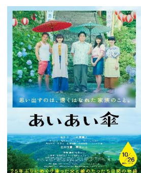
上映映画『あいいい傘』